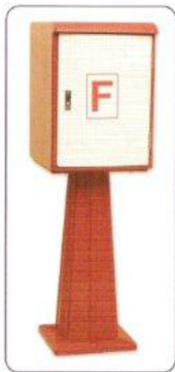
Modelo D Caseta para dotación de hidrantes